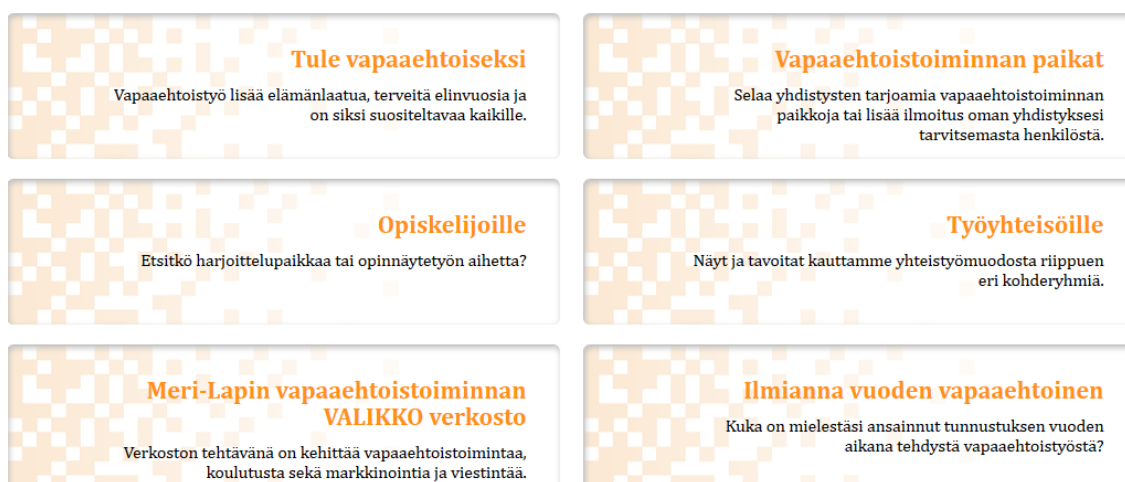
Kuva 8. Vapaaehtoistoiminnan laatikkohaku