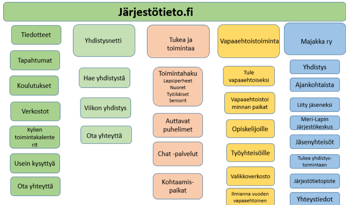
Kaavio 1. Sähköisen alustan toiminnallinen rakenne

Tämä sähköisen alustan toiminnallinen määrittely kuvaa kehitettävän alustan toiminnallisia vaatimuksia. Toiminnalliset vaatimukset kertovat miten sähköisen palvelutarjottimen halutaan toimivan ja millaisia toimintoja siinä pitää olla. Toiminnallinen määrittely ei sisällä teknisiä ratkaisuja, vaan ne ovat erikseen kirjattu tekniseen määrittelyyn. Alla olevassa kaaviossa näkyvät pelkistetyksi sähköisen alustan pääsivusto (järjestötieto) ja siihen sisältyvät osiot. Hyvinvointitarjottimena toimii tukea ja toimintaa- osio.