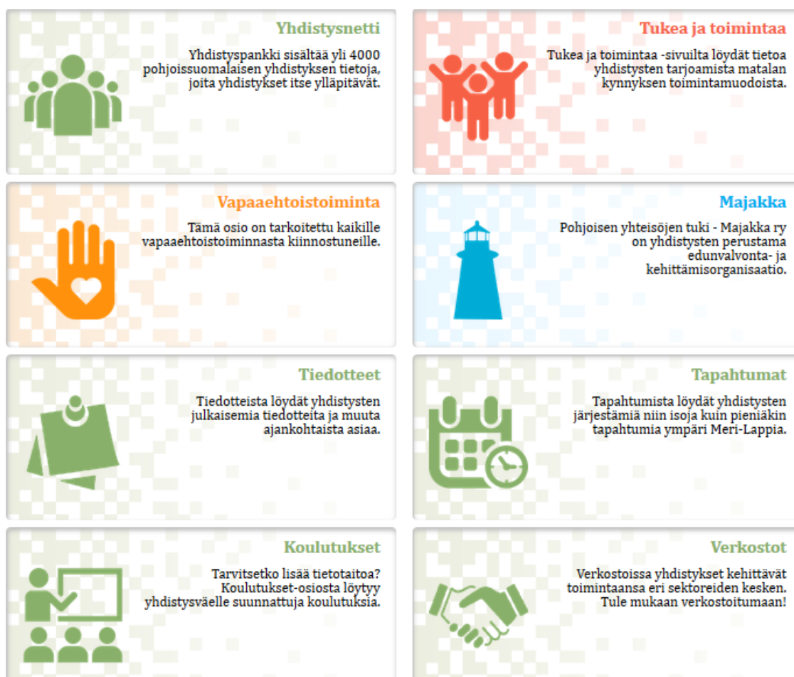
Kuva 7. Järjestötieto-sivuston laatikkohaku

Yhteistyöverkostoista löytyvät alueen järjestöjen kehittäjäverkostot, kuntien nuoriso-, ikä- ja vammaisneuvostot, kyläneuvostot, kokemusasiantuntijat ja maakunnalliset järjestöverkostot.