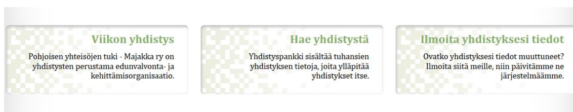
Kuva 8. Yhdistysnetin etusivun laatikkovalinnat

Sivustolle on koottu kaikki PRH: sta löytyvät Lapin kuntien yhdistykset, julkishallinnolliset Suomen Punaisen Ristin paikalliset yhdistykset sekä osa Pohjois-Pohjanmaan yhdistyksiä. Sivustolle on lisätty myös valtakunnallisia järjestöjä. Lisäksi sivustolta löytyvät myös järjestöjen paikallisia kerhoja, jos he ovat lisänneet esittelynsä yhdistysnettiin. Yhdistysnettä päivitetään määrätyn väliajoin, jolloin sieltä poistetaan lopetetut yhdistykset ja lisätään uudet yhdistykset. Jos yhdistystoimija ei löydä yhdistysnetistä yhdistyksensä tietoa, hän voi ilmoittaa yhdistyksensä tiedot majakan tietotiimille, niin ne päivitetään järjestelmään.