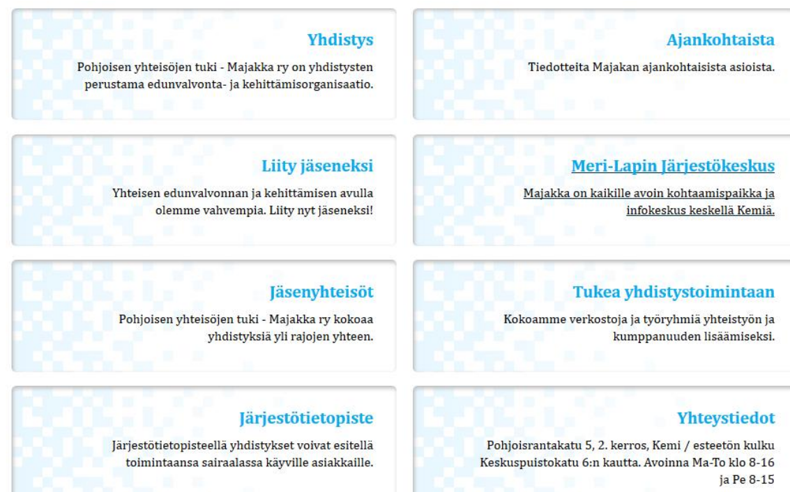
Kuva 19. Majakka ry- sivuston laatikkohaku

Tämän sivuston eri osioissa kerrotaan Majakasta yhdistyksenä, jäsenyhdistyksissä ja Majakan hallinnoimista hankkeista. Majakan tarjoamat tilapalvelut löytyvät sivustolta ja siellä voi myös liittyä jäseneksi. Sivustolta löytyvät myös linkit Majakan blogiin sekä Facebook - ja Instagram - sivuihin.